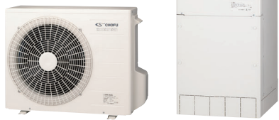
ヒートポンプユニット 貯湯ユニット ※脚部カバーは別売品です。